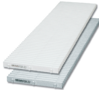
ASM-Profil FSR Meter